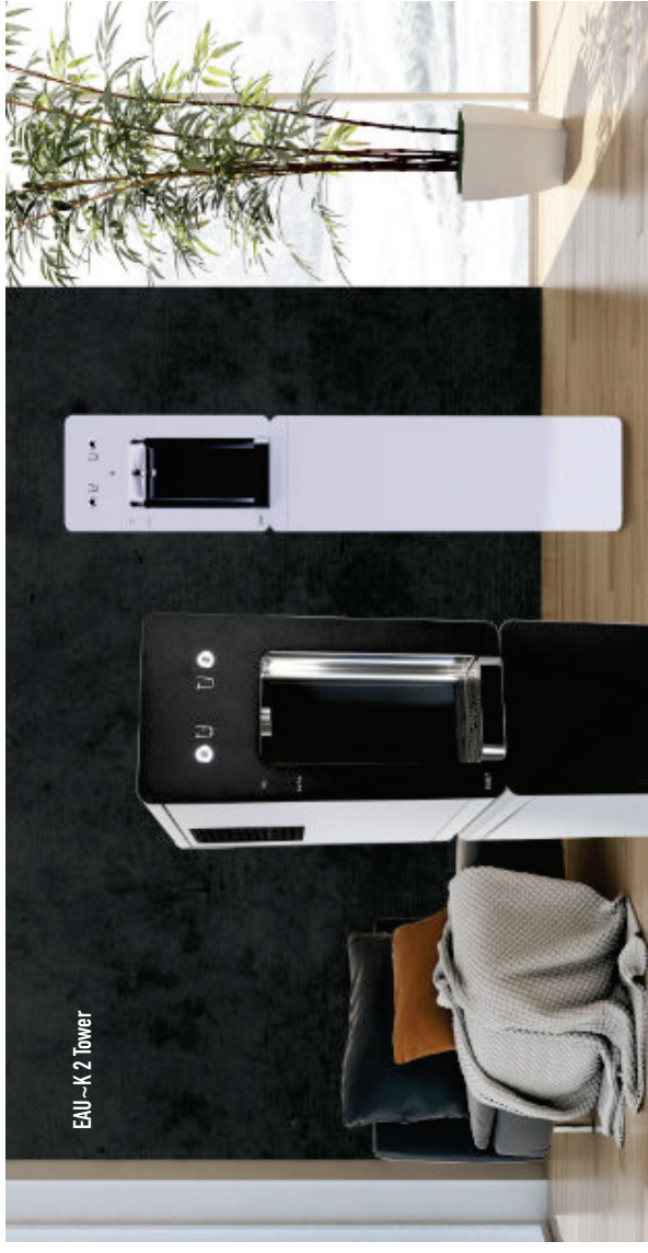
EAU~K 2 Tower