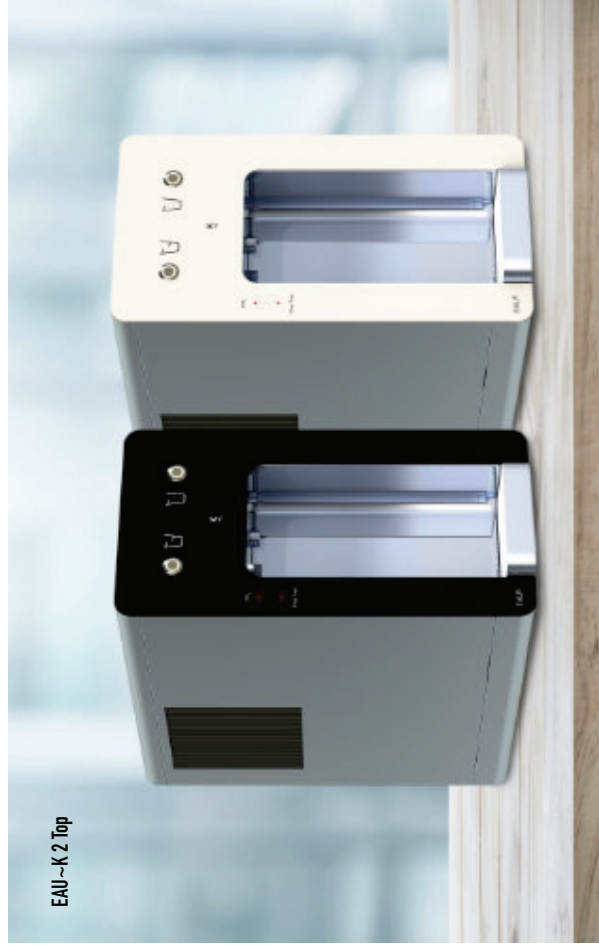
EAU~K 2 Top

Alle EAU~K Premium Wasserspender sind mit dem PURE Multilayer- Hochleistungsfilter und der TKS Tap Desinfektion ausgestattet.