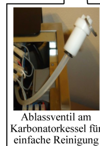
Ablassventil am Karbonatorkeßel für einfache Reinigung

Tropfschale mit Ablaufstützen. Ist ab Werk verschlossen und kann bei Montage geöffnet und angeschlossen werden